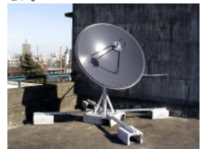
8号館屋上に設置されたアジアサット2デジタル衛星放送受信用パラボラアンテナ(直径1.8m)

DESK事務室ではアジアサット2経由のヨーロッパ諸国のテレビ・ラジオ衛星放送が受信できるようになりました。受信可能な放送と利用方法についての詳細は、このニュースレターの最終ページをご参照ください。